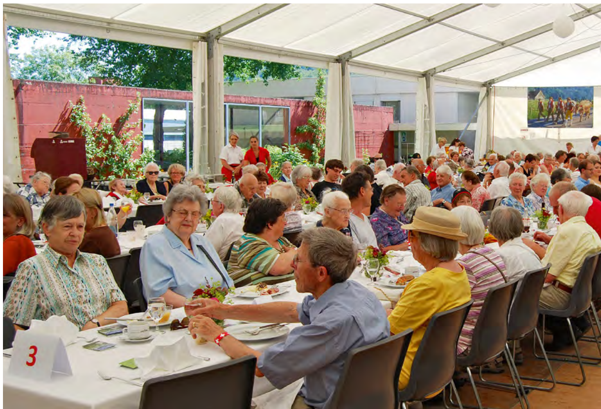
Der 1.-August-Brunch 2012. Öffentliche Festanlässe im Kehl fördern den Dialog zwischen Jung und Alt und wirken der Isolation entgegen.

schaftssinn und sichert notwendige soziale Strukturen, die auch in Zukunft Bestand haben werden.