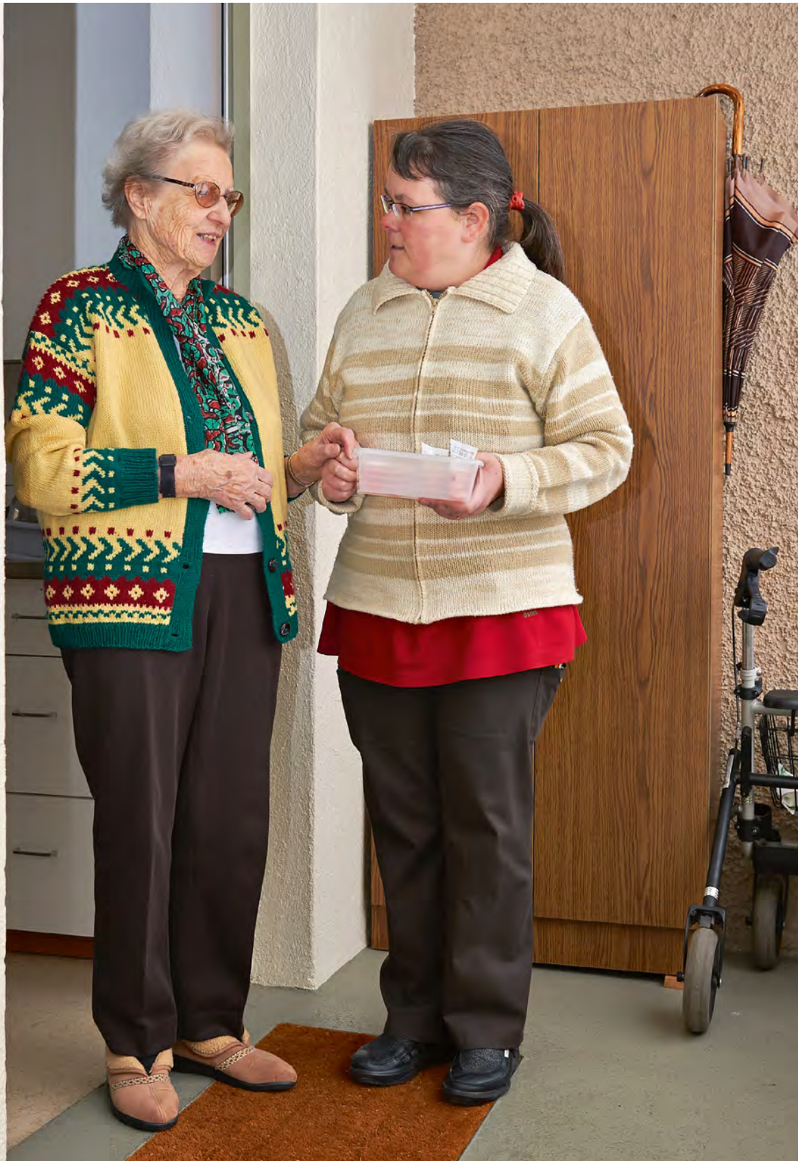
Was gibt es Neues? Unsere Spitex-Mitarbeiterinnen sorgen rund um die Uhr für die Bedürfnisse der Bewohnerinnen und Bewohner in den Alterswohnungen.