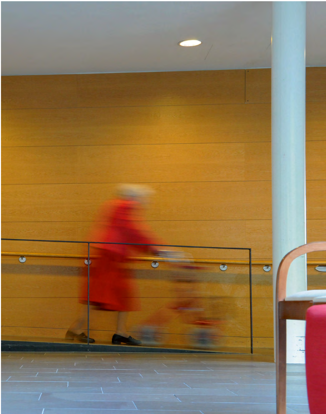
Altersgerechtes Bauen ist ein wichtiger Beitrag zur Eindämmung der Gesundheitskosten.