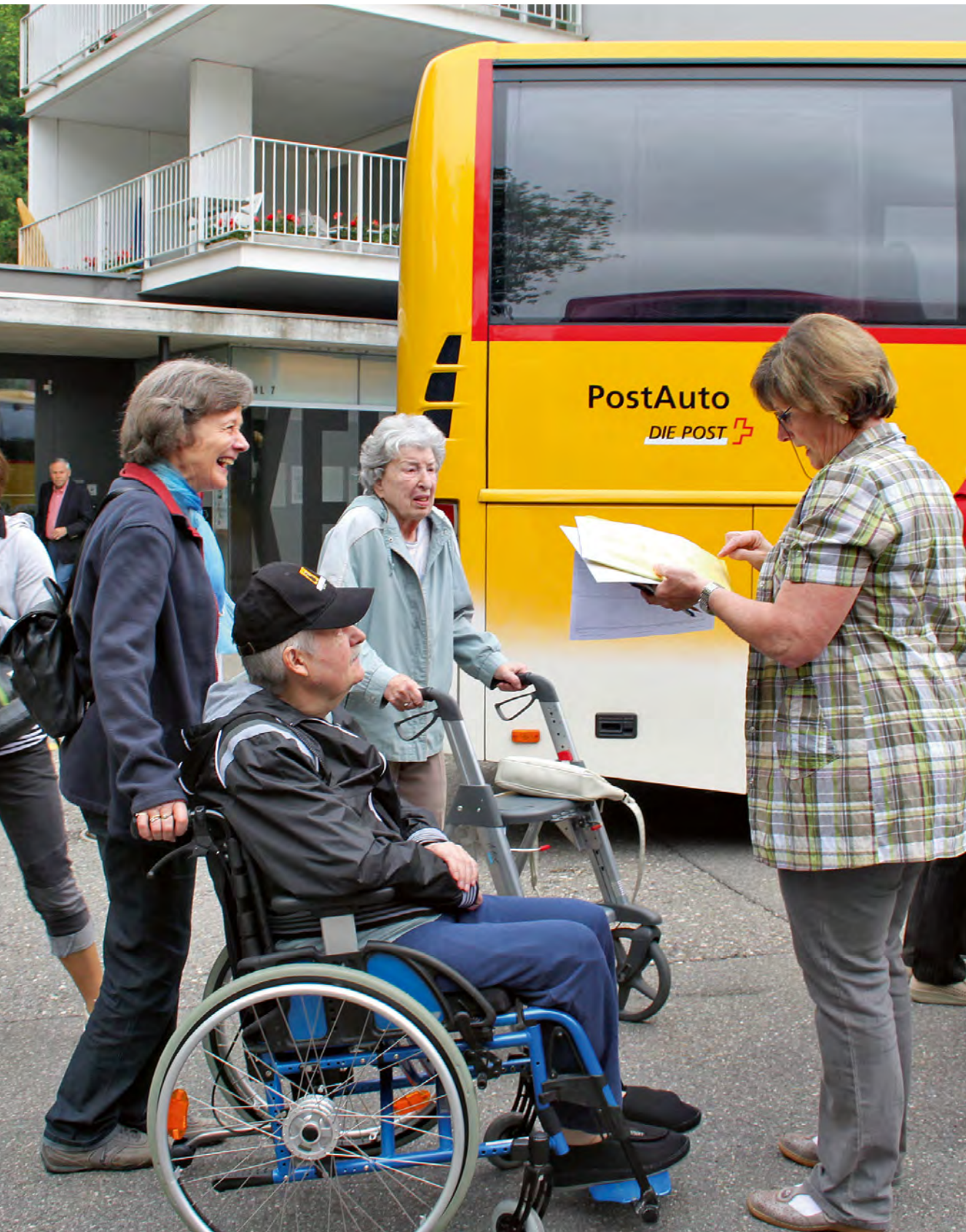
Ohne Freiwillige geht nichts. Die freiwilligen Helferinnen und Helfer begleiten Bewohnerinnen und Bewohner des Kehls auf dem jährlichen Ausflug.