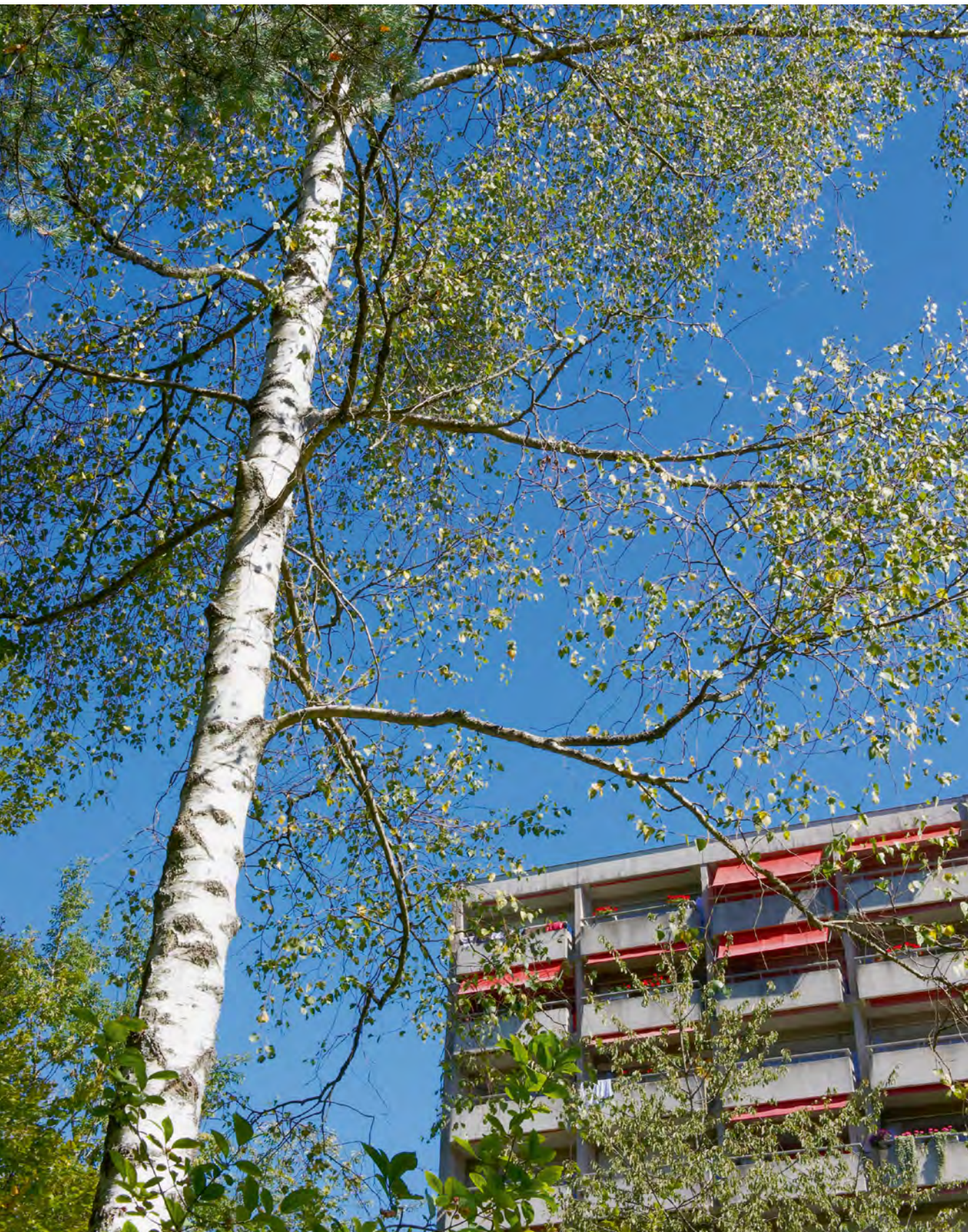
Das Hochhaus im Kehl, seit 48 Jahren ein Wahrzeichen von Baden.