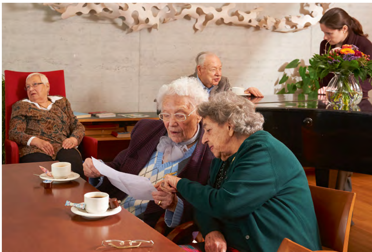
Treffpunkt Kehl. Ein breites Unterhaltungs- und Veranstaltungsprogramm ermöglicht den Bewohnerinnen und Bewohnern, Angehörigen und Gästen einen regen Austausch und begegnet der Gefahr der Vereinsamung.