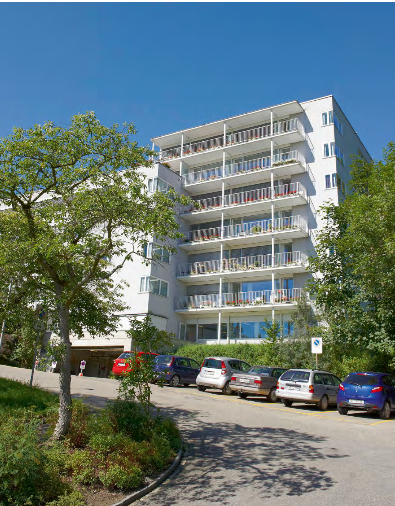
Trotz guter Anbindung an den öffentlichen Verkehr braucht es genügend Parkplätze.