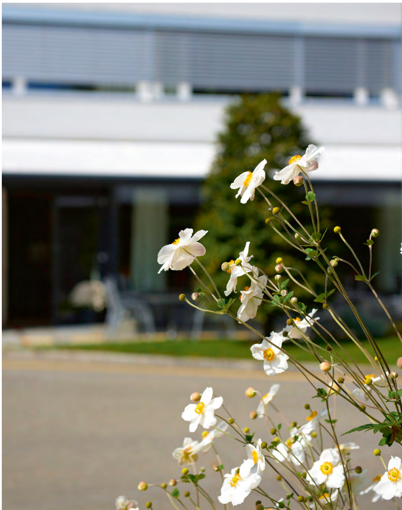
Frühlingsbeginn im Kehl.