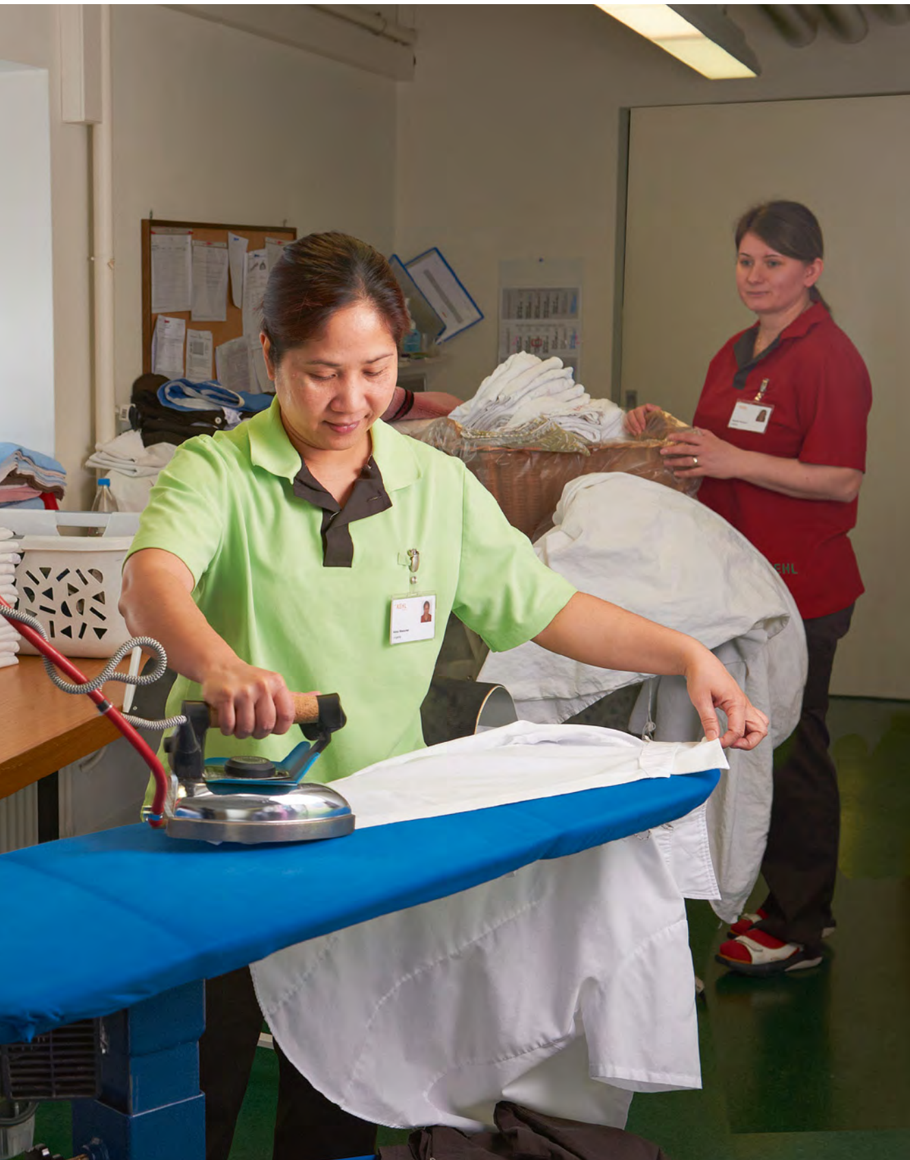
Fleissige Hände. Das Angebot der Wäscherei im Kehl kann zukünftig auch von externen Kunden genutzt werden.